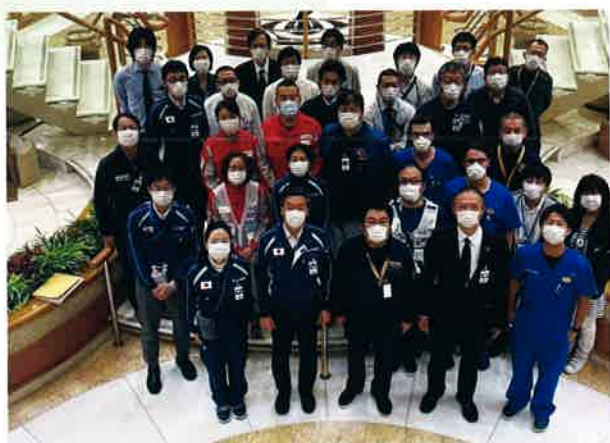
ダイヤモンド・プリンセス号の船内は非常に厳しい現場でしたが、橋本岳厚労副大臣（前列左から2人目）をはじめ、スタッフ全員が心をつなげて対応に当たりました。

2月3日、ダイヤモンド・プリンセス号に対し検査法に基づき臨船検査を開始し、積極的な疫学調査やPCR検査を始め、複数名の新型コロナウイルスへの感染者が確認されたため、クルーズ客船に対する検査の一連の対応が開始されました。2月10日から3月1日まで、現場での指揮に当たるため、橋本岳副大臣と共にクルーズ船内での活動を始めました。DMATには新型コロナウイルス陽性者や、感染の有無に関わらず急病などで下船する乗客・乗員の対応を、日赤チームには、船内の発熱以外の疾患対応を、日本薬剤師会、日本病院薬剤師会、日本医薬品卸売業連合会には、約2000名の乗客の常備薬対応を行っていただきました。DPATの先生方には、クルーズ船のほか帰国者の滞在施設などで心のケアに当たって頂きました。JMAT、AMATの先生方には、組織をあげて約3700名の乗客・乗員に対し、下船に向けての要件となった医師による健康チェックの間診を行っていただきました。