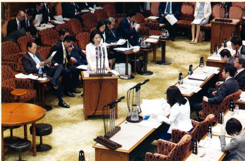
3月26日、参議院予算委員会にて、新型コロナウイルス感染症に関し、妊婦の不安解消に向けた対応等について答弁しました。