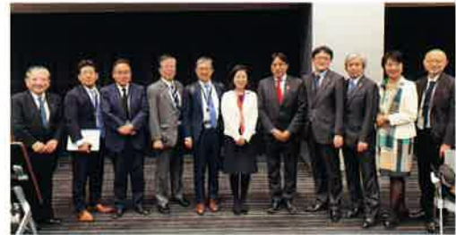
1月29日、設立総会終了後に記念撮影

2月20日には第2回総会を開催し、日本理学療法士協会、日本作業療法士協会、日本言語聴覚士協会、日本リハビリテーション医学会、日本失語症協議会からのヒアリングを実施しました。