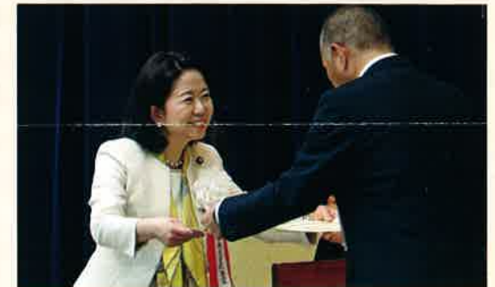
1月10日、安全優良職長厚生労働大臣顕彰式典にて、労災防止のために尽力され、功績が顕著であった122名の皆様を安全優良職長として顕彰させて頂きました。