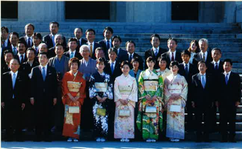
1月20日、心も新たに第201回通常国会が開会しました。