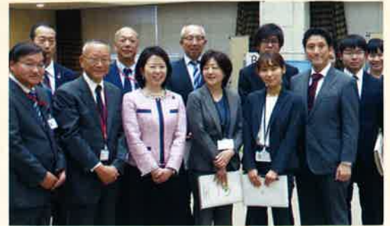
1月7日、厚生労働省内で行われた献血・骨髄バンクドナー登録会場を視察しました。