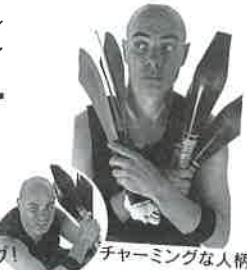
チャーミングな人柄!