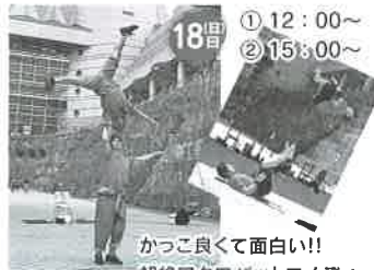
かつこ良くて面白い!! 超絶アクロバットコメディ